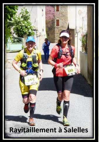
Ravitaillement à Salettes