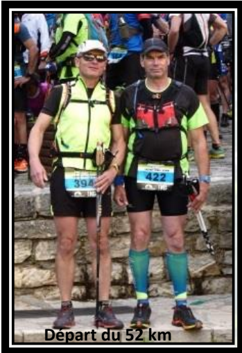
Départ du 52 km