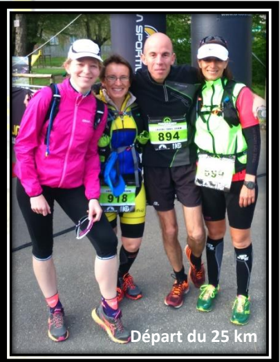
Départ du 25 km