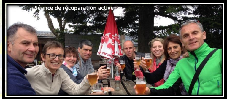
Séance de récupération active